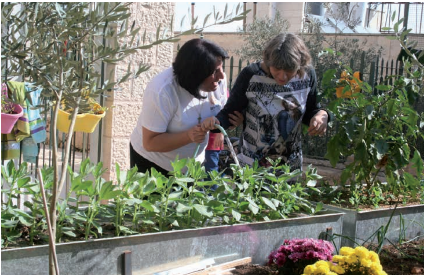
In de loop van het jaar is er een 'tuinbouwprogramma' uitgevoerd.

“De afgelopen jaren hebben we een band van liefde opgebouwd. We hebben geprobeerd vanuit de christelijke gedachte de volgende zaken te leren: respect voor de ander, nederig te zijn, samen te werken en behulpzaam te zijn. Er is mede daardoor een stevige band van liefde tussen alle bewoners en personeelsleden ontstaan in Jemima.